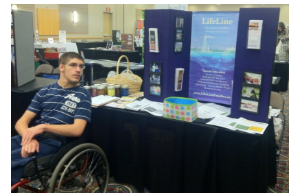
PJ va a la Universidad mientras hace un voluntariado en una organización de discapacidades.